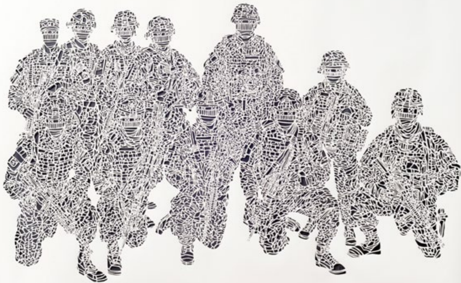
Olivier Hözl Tesir Noktası Point of Impact Kesilmiş kağıt Paper cutout (200g) 135x200cm 2011 Sanatçının izniyle Courtesy of the artist

Olivier Hözl 'ün çalışmaları öncelikli olarak güç mekanizmalarının dinamiklerini araştırarak aile, okul ve askeriye gibi kurumların, güç yapılarını içselleştirme sürecine nasıl iştirak ettiklerine dair sorular yönelir. Dönüm Noktası başlıklı kitabı ve aynı adı taşıyan videosu, aile yapılarına, sembolik öğrenime, din ve güce dair özgün bir analiz sunar.