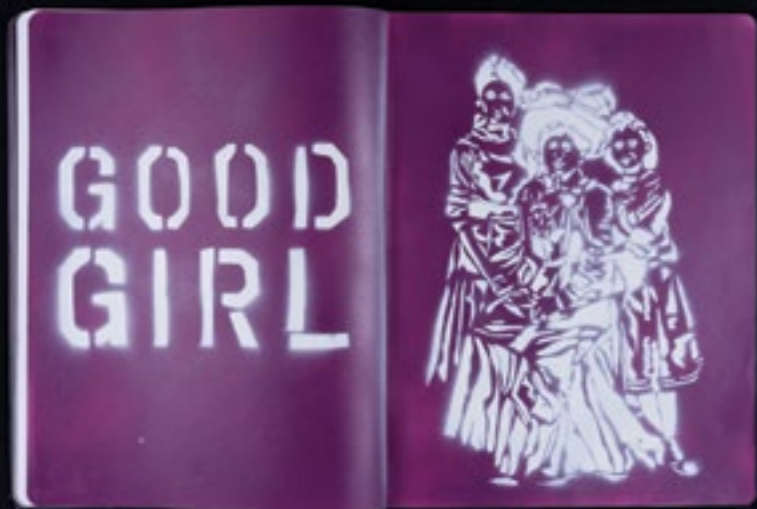
Olivier Hözl Dönüm Noktası Turning Point Kitap, 110 Sayfa Book, 110 pages Karışık malzeme Mixed media 31,5 x 41,5 x 1,7 cm 2014

Olivier Hözl 's work primarily explores the dynamics of power mechanisms and poses questions about how the institutions of family, school and the military participate in the process of internalizing power structures. His book and video with the common title Turning Point offer an analysis of family structures, symbolic learning, religion, and power. The Point of Impact shows a group of anonymous soldiers without giving a reference to their countries or missions. The military is one of the main institutions that are widely recognized and respected in almost every country. Its existence persistently reminds us of the possibility of war. For countries in transformation, where the military service is obligatory at least for the male half of the society, the army is overwhelmingly dominant both for those who serve in it as well as those outside of it.