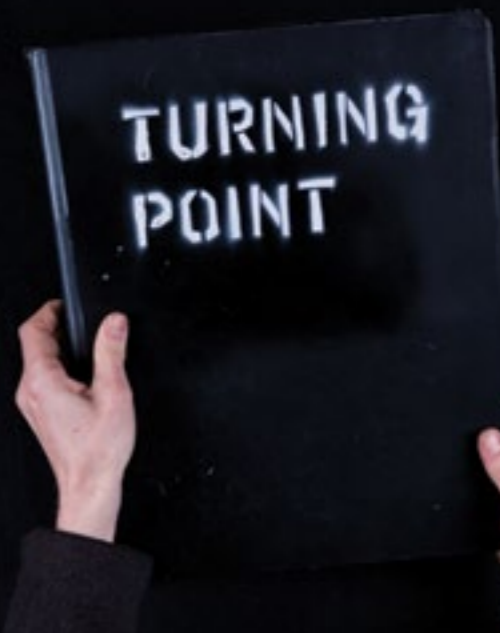
Olivier Hözl Dönüm Noktası Turning Point Video, DVD 06'28" Edisyon Edition 8 2014