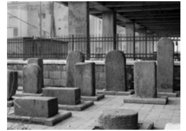
Pinar Öğrenci Kutsallığın Evrimi: Taş ve Beton Evolution of the Sacred: Stone and Concrete Fotoğraf Photograph 48x68 cm. 2014 Edisyon Edition 8+1AP