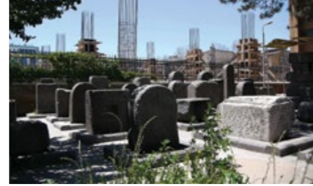
Pinar Öğrenci Kutsallığın Evrimi: Taş ve Demir Evolution of the Sacred: Stone and Iron Video 02'37" Edisyon Edition 5

A primary school next to the museum - where the artist had studied - was demolished in 2010 to make place for a shopping mall. The museum will be moved into their new premise that is newly built right in front of the historical castle within a supposedly protected area where construction is forbidden. At the video entitled Evolution of the Sacred: Stone and Iron , Öğrenci suggests a solidarity with the city, whose capacity is challenged, by symbolically erasing the iron bars raising from the construction site. The installation highlights the sad absurdity of this mode of urban development by juxtaposing cheap glass buildings with the castle and the steles of the ancient cemetery with a construction site, among others.