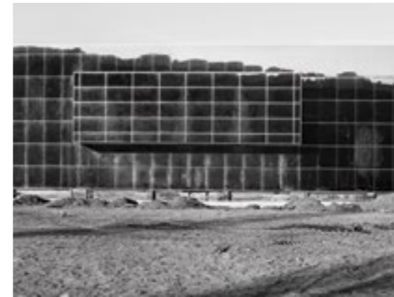
Pinar Öğrenci Kutsallığın Evrimi: Taş ve Ayna Evolution of the Sacred: Stone and Mirror Fotoğraf Photograph 48x68 cm. 2014 Edisyon Edition 8+1AP